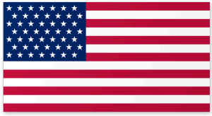
Spojené státy americké