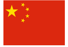
Čínská lidová republika

Toto postavení stálých členů vychází z poválečného uspořádání, kdy právě tyto mocnosti sehrály klíčovou roli při vzniku poválečného bezpečnostního systému.